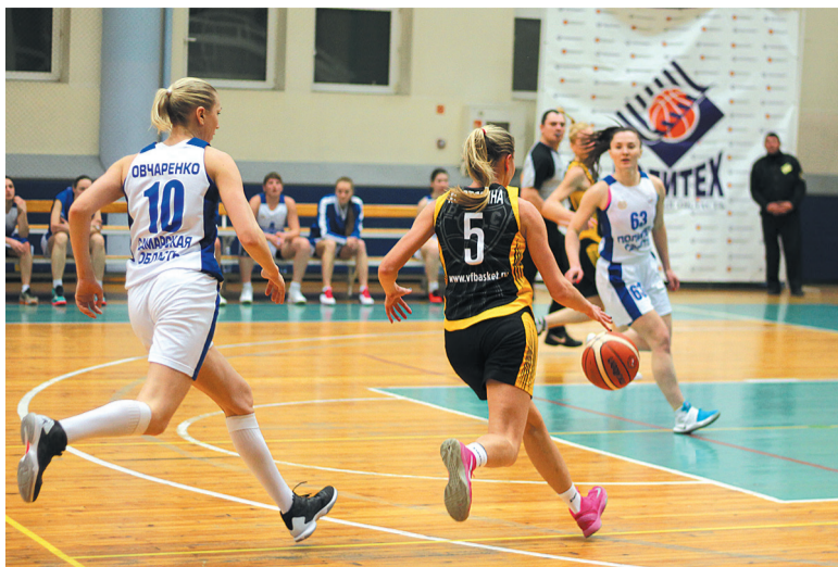
Во всех играх марта команда «Политех – СамГТУ» не оставляла соперницам шанса выиграть.