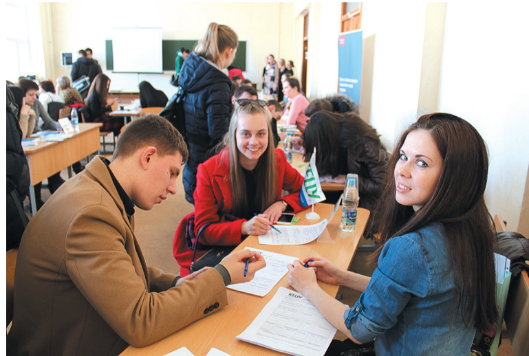
Рассмотрев предложения о работе, студенты оставили свои контактные данные.

– Нашу работу отличает постоянная динамика. Мы осваиваем новые виды продукции, проводим эксперименты по её совершенствованию. Специалисты презентуют