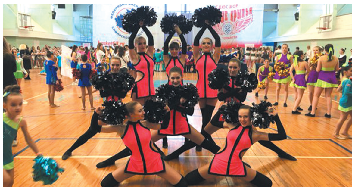
Выступления группы поддержки «Манго» украшают соревнования баскетболисток.

– Я окончила инженерно-экономический факультет СамГТУ. Про чирлидинг узнала только тогда, когда тренер написала мне в «ВКонтакте» и предложила попробовать свои силы. До этого я увлекалась бальными танцами. Когда пришла в команду, боялась, что не подойду по росту; у меня 160 см, а в объявлении было написано, что рост должен быть не менее 165 см. Но меня приняла, чему я очень рада, потому что у нас и команда дружная, и тренер замечательный.