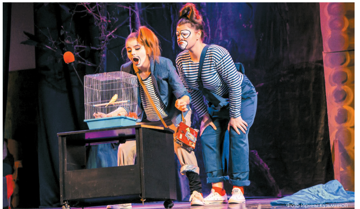
Номер с птичкой стал одним из самых запоминающихся в программе студвесны.