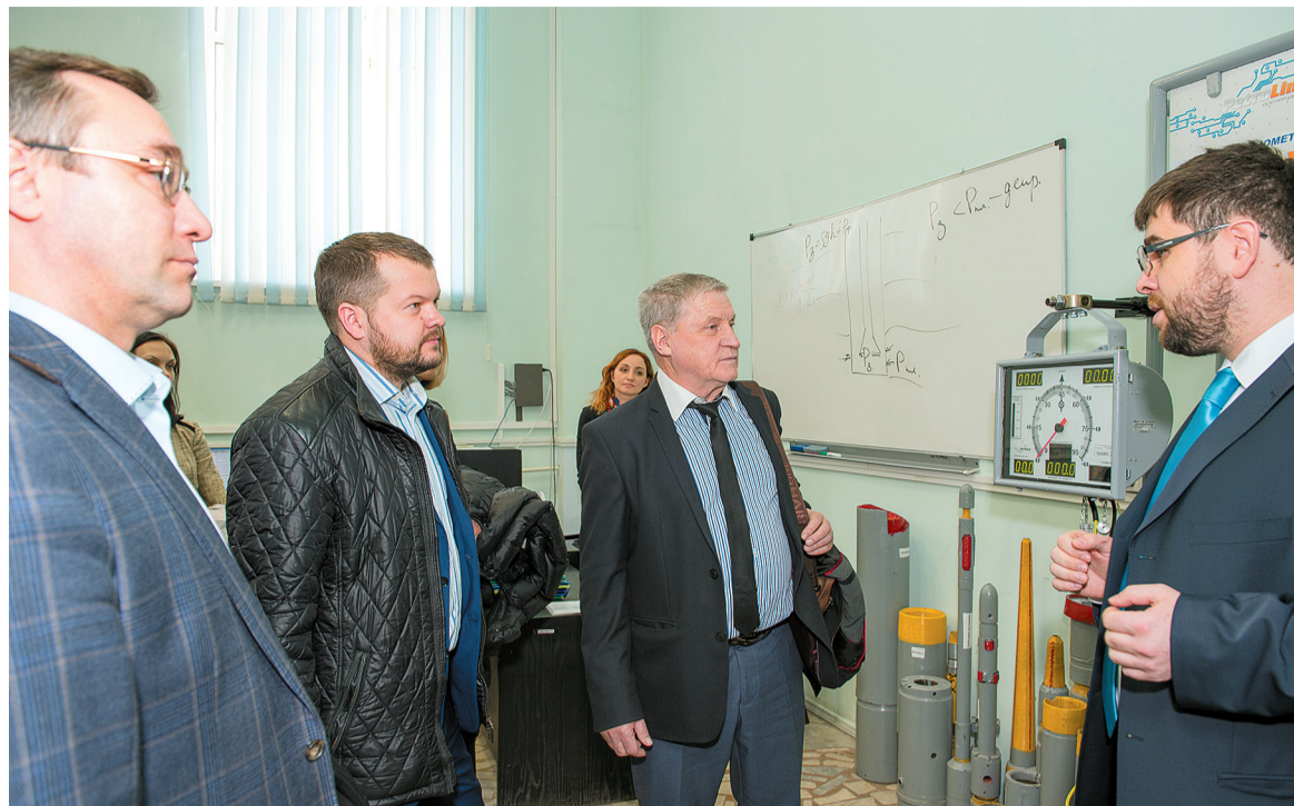
Делегация из «Сколково» побывала в лаборатории НТФ.

20 марта Политех стал площадкой для проведения в Самаре второго, заключительного тура 38-й межрегиональной олимпиады школьников «Турнир имени М.В. Ломоносова». Организовали интеллектуальное соревнование в стенах вуза сотрудники кафедры «Прикладная математика и информатика» СамГТУ. В ежегодном многопредметном состязании приняли участие 40 учеников 10-11 классов школ Самарского региона. Письменные работы ребят отправлены на проверку в Москву, результаты будут опубликованы на сайте олимпиады.